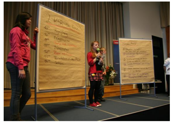
Das nächste KSR-Sonderschulforum kommt bestimmt. Der KSR-So freut sich schon jetzt auf den Herbst 2011.